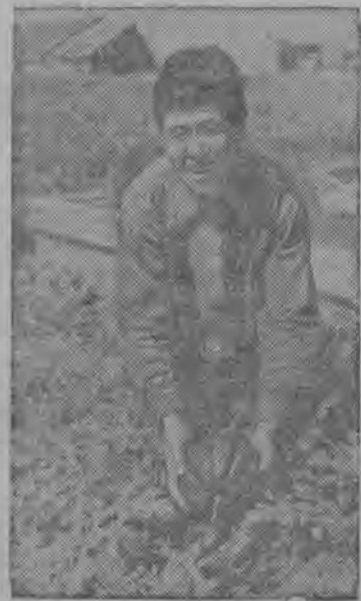
СНИМОК ВbЛЫН: Александровской молочно-овощной совхозса (Сахалин) рабочбй идралб парникын бьдтбм арбуз.

йб обеспечитбма влагадн. Канал стрббитбмбн поливной площадьюс содб 1500 гектар вылб. (ТАСС).