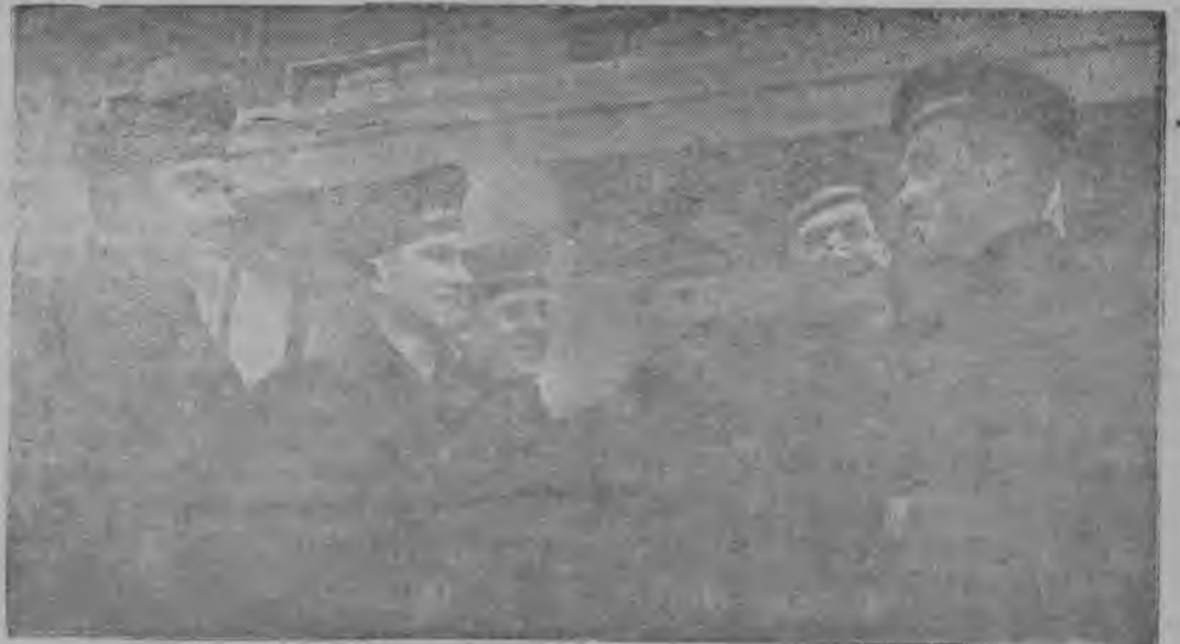
Москваын котырѳма специальнѳй военно-морскѳй среднѳй школа. Сѳѳ гѳтѳвитѳ темѳѳѳс Военно-морскѳй флотса училищясѳ пьирг кежлѳ. СНИМОК ВЪЛЫН: велѳдчысьяслѳн группа виль форманы.