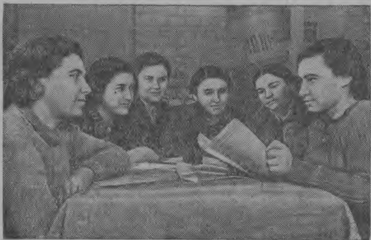
Кишиневын 1-й государственной табачной фабрика бердса РОКК оргкомитетлбн заседание.

Сыктывдинса райсбветын депутат 14-бд номера Вильгортской избирательной округсян.