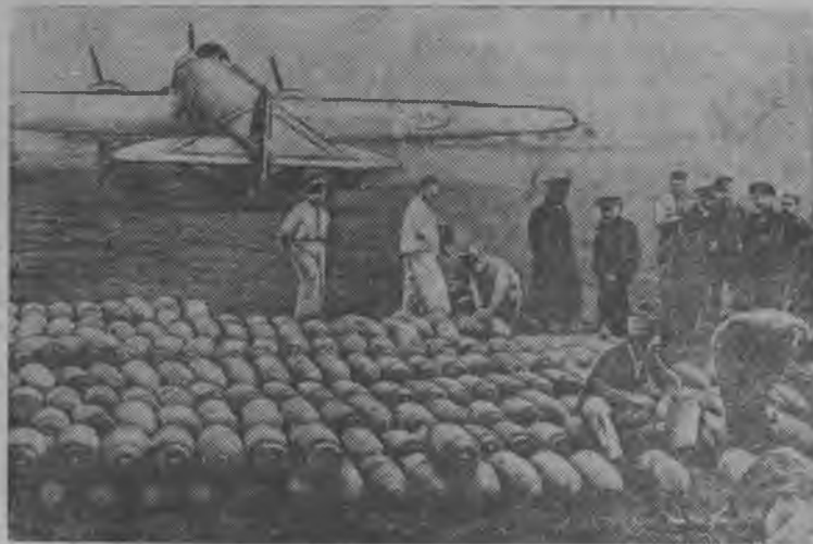
Албанияын итальянской авиационной база.