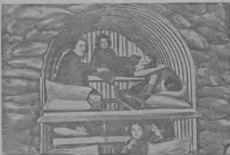
Англияса Андерсонын бомбѡубежищелѡн пытшкѡсса вид.

ЛОНДОН, 9. (ТАСС). Рейтер агентствѡлѡн Нью-Йоркса корреспондент передаетѡ, мый талун Нью-Йоркѡ самолет вылын Англияысь воис Уилки.