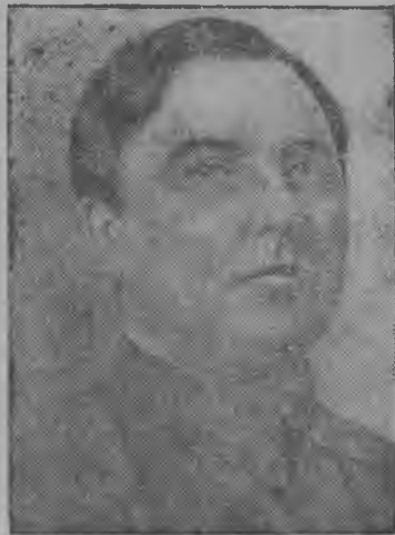
Г. М. Маленков,

Предприятиеясын татшбм положениекбд колб помав-ны. Быд предприятиебн да быд лун планъяс выполняйтбм—XVIII Ставсоюзса пар-тийной конференциялысь решениеяс олбмб прбтбм.