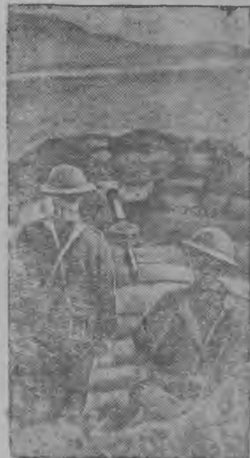
Пулемётной гнездо Англияын туйяс пысь бтиын.

щание вылын. Но тайб сёрниельс сёрнибн и коли. Скотвидзбм кузя специальствьяс асланыс кбсьысьбм йылысь, кодбс найб босьтлсны совещание вылын, вундчысны. Вильгортса колхозьясын напирмер, абу котыртбма ни бти зоотехнической кружок. 1941 воын „Красный партизан“ колхоз да сэтчбс руководительяс долженбс вбчны ыджид перелом общественной животноводство развивайтомлы. На лбн мог тырвийб укомплектуйтны став животноводческой фермаяс, тырвийб сохранилны молодняк, ве лэдзын скотсб хищнической бырбдбмысь ни бти случай. Кировской областьяса Халтуринской да Сытыв районьяскбд ордысьбм кузя видзму овмбсса передовикьяслбн районной совещаниебн босьтом обязательство выполнитомын „Красный партизан“ колхоз должен сувтны воддза радьясб. М. ИЛЬЧУКОВ.