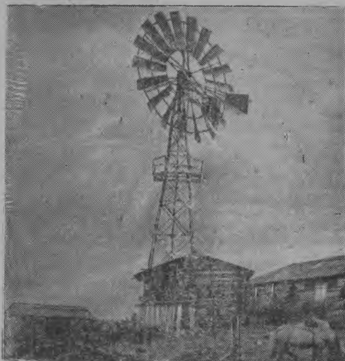
Вильгортса „Красной Маяк“ колхозон ветряной двигатель, кодбс стрбнтбма таво. Двигатель вайббб движениеб колхозной мельница да сетб ва скбтнбй дворьясб.