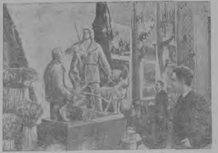
Ставсоюзса сельскохозяйственной выставка вылын. „Ленинград да РСФСР-лӧн Асыв-Войвыв“ павильонса Коми АССР залын.