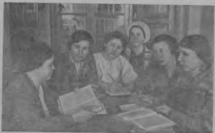
Солнечногорской районной библиотеказын сиктса библиотекарьяслөн группа „ВКП(б) историялөн краткөй курс“ кузя бчереднөй консультация вылын.