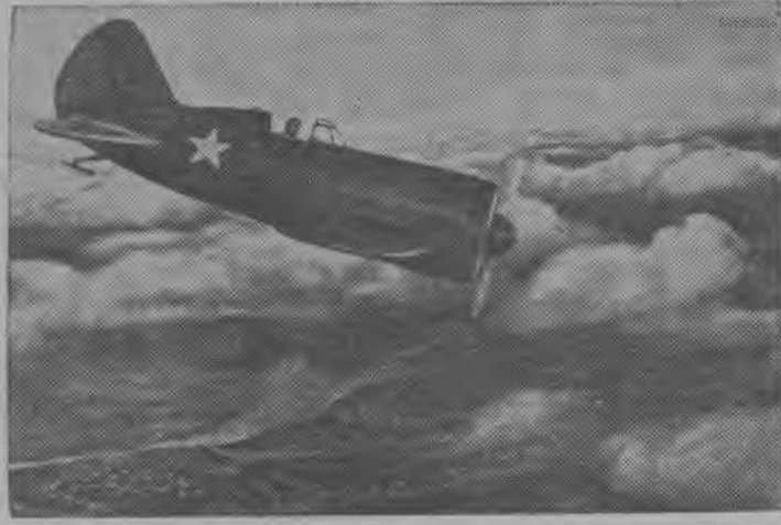
Советской истребитель разведканы.

Ми ставон, кызди ёти, дасёбё сувтны да киясын оружиеён дорйяны асёныным радейтана рёдина. Победа лёд миян сайын. Миян дело правдой. Фашизм да сылён кровожадной извергьяс Гитлер да Риббентрон адзасны асланыс гу тайё медбёръя решительной схваткаын, кодёс найё панёсны кыксёмиллионной советской народлы паныд“.