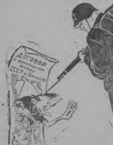
Пощадатёр разгромитам да бырдём врагёс. Рис. худ. Кукрыниксылн.