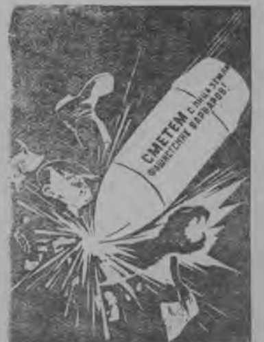
Рис. худ. Долгоруковлн.