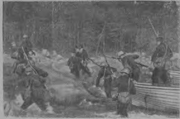
Действующий Краснознаменный Балтийский флот. Балтиецясыс, чеччодоны десант вражеской дль выло.