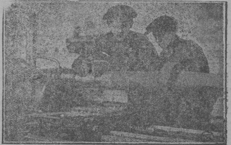
Картина вылын: механизм течан цехын, „Катерпилер“—трак-торлы валсö јостöм.