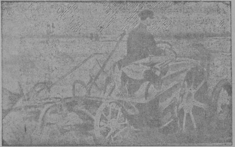
Герпс вылын: коммуна „Југор“ колхоз гөрө тракторө