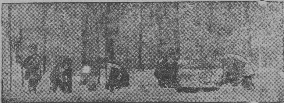
Сөтбар өкөт колхозса бригадәбө ужалөбө вөрын уд-рөјдә.

Прөндор да Іпат өкөтсө колхознікјасөс да гөл-шөркөдө олыс јасөс чуксалоны вөтчыны ас бөрсаныс петны вөрбө, медем Прөндор да Іпат вермісны шыбытны асыныс позорнөј рөгөзә зна-мјасө. Субботін