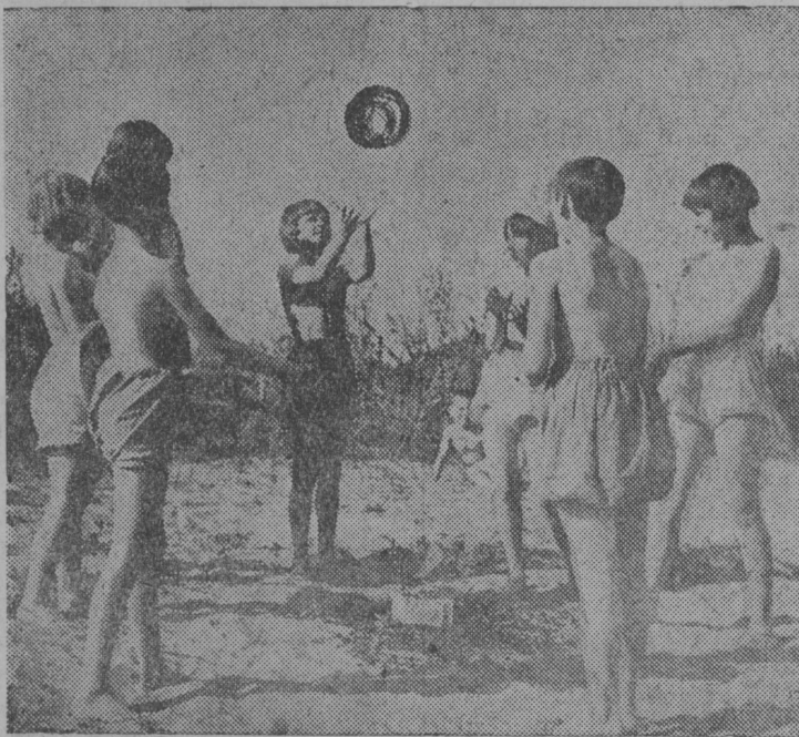
Міча лунјасö гажаа ворсöны мјан челаа. СНИМОК ВЫЛЫН: Сыктывкарса школајасын велöдчыяс урокяс бöрын Сыктыв ју берег вылын ворсöны пионербөдөн.

Мај 25-öд лунö мöд лунжыняс выставкалөн 10 ворта восеасны публикалы.