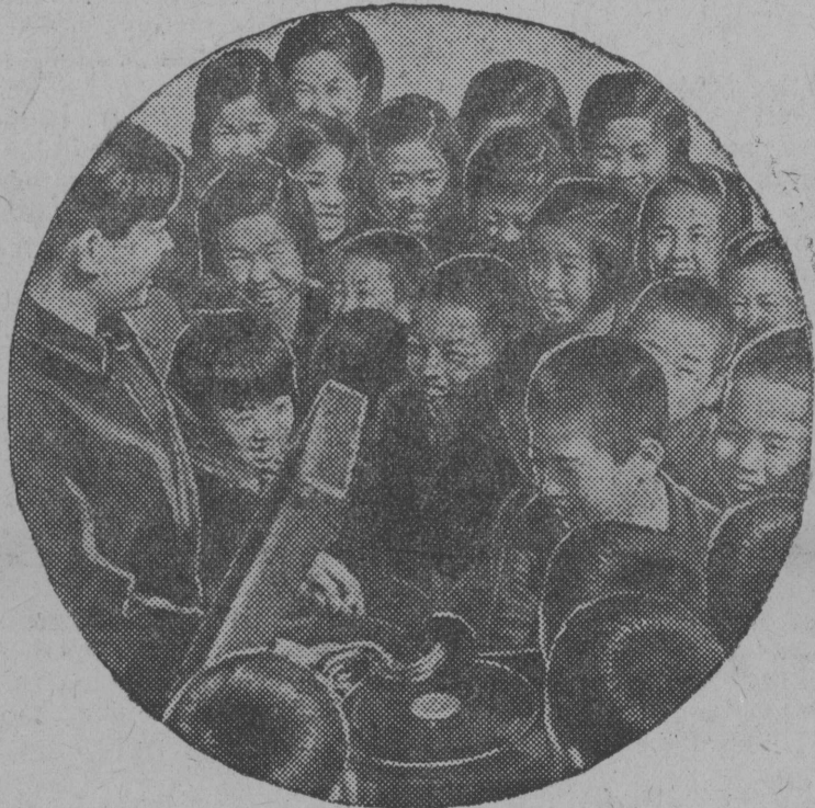
Сталин нима Корейскөй колхозыс (Уссуријскөй обл. СВК) велөдчыс челад перерывјас дырји рафөјтөны кывзыны асланыс кыв вылын патөфон. ГЫМОК ВЫЛЫН: Рејбата патөфон дорын.

— Водопјанов, Шмидт да мукөд јортјасдн војвыв полусө локтөм,—воэ висталөны велөдчысјас,—мијанөс чуксалө наукајас буржыка осваиватөмө, социалистическөй рөбинасө помтөма рафөјтөмө. Карпов.