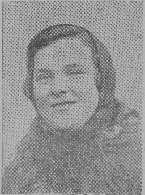
А. М. Оплеснїна јорт—Пажгаса МТС-ыс тракто- рїстка.