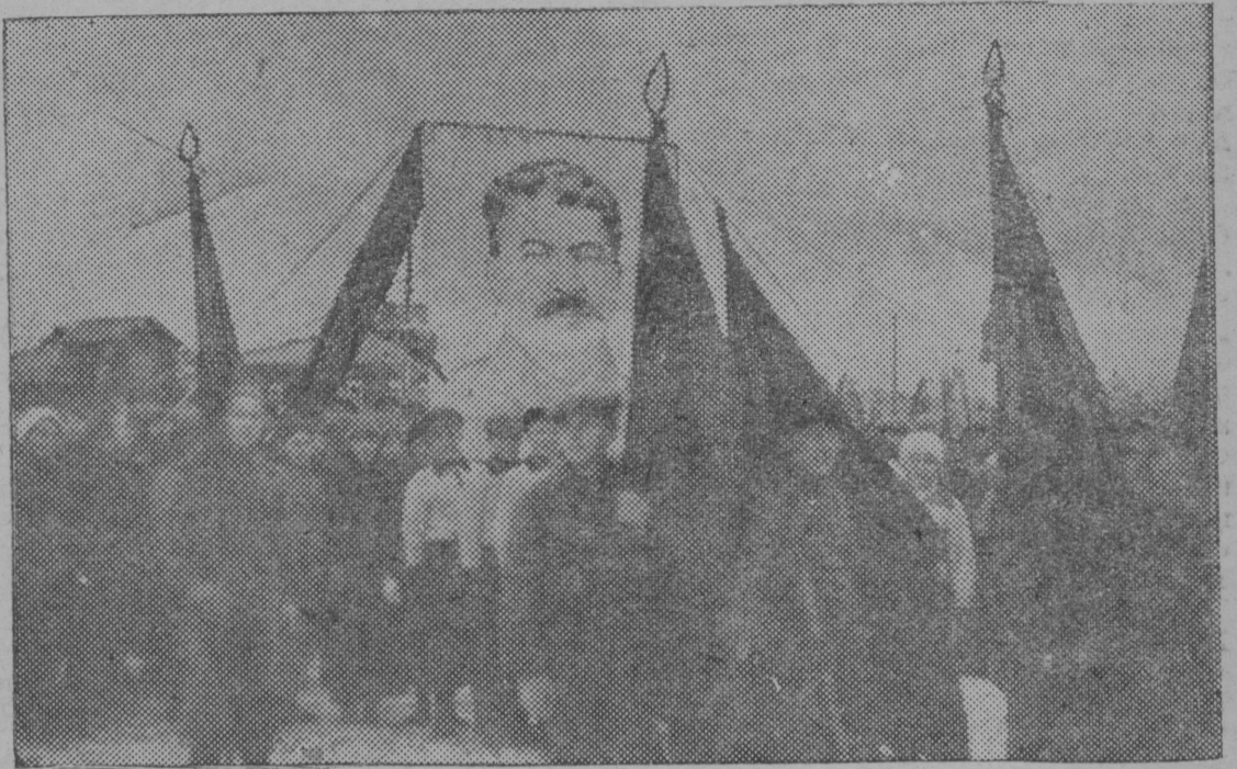
Сыктывкарса ужалыс јџџ Великџџ Октабрскџџ Соціалістическџџ Революціјалы кыџџ во тыран лунџ мџтінг вылын.

Н. К. Крупскаја. М. М. Лџтвінов. В. М. Молотов. А. І. Мікојан. д. З. Мануїлскіј. Л. З. Мехліс. Г. І. Петровскіј. І. В. Сталін. Н. С. Хрущев. В. Ја. Чубар. Н. М. Швернік. Р. І. Ејхе.