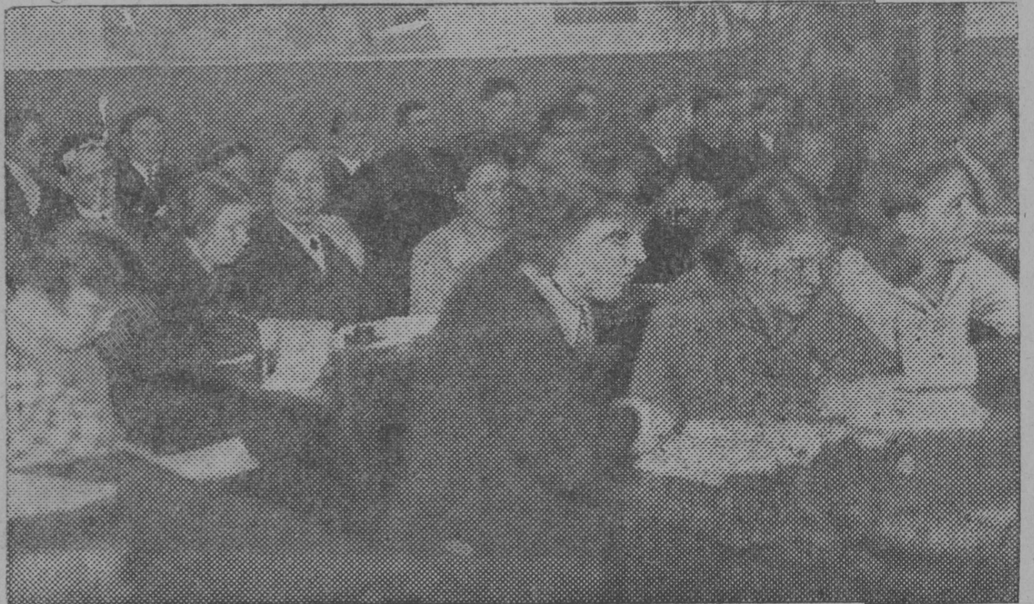
Сымок вылын: Пединститутса студентјас вөлдöдны избирательнő закон.

Та јылыс висталö Шустиковлөн да Чумановлөн делö, кодјасос сјö став выныс зашщисщатіс кык бјуро вылын. Та јылыс-жö висталöны і Печераын лöм фактјас. Отчотјас да бөрјысöмјас нудöдмogyс Печераö вöлі командірујтöма Худажевос, көні сјö организацијалы врагјаскöд