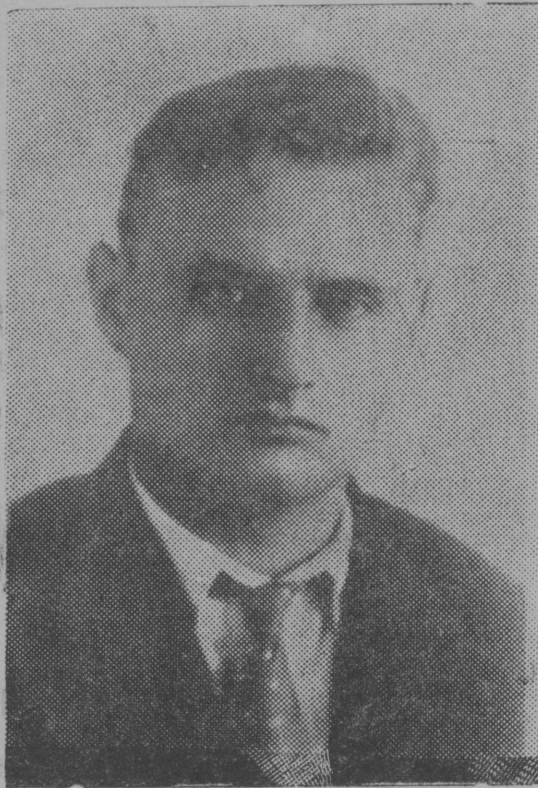
Сӱветскӱй Союза Герой Константин Сергеевич Бадигин.

Руководящӱй комсомольскӱй активлӱн марксистско-ленинскӱй велӱдчӱмын ӱнӱя самотек дзӱк абу терпитана. Сыкӱд колӱ решительнӱа помавны. Комсомольскӱй организациясын колӱ лӱсӱдӱны сӱтшӱм обстановка, медым найӱ ӱртъяслы, кодъяс оз велӱдчӱны либӱ омӱля велӱдчӱны, вӱлӱ яндзим сысь. Кад нин гӱгӱрвоны, мый руководящӱй активн марксистско-ленинскӱй теорияӱн овладейтӱг комсомол оз вермы пӱртны олӱмӱ партиалӱн помощниклысь почетнӱй роль. Некор оз позь вунӱдлыны Сталин ӱртлысь кывъяс сы йылысь, мый „терпеливӱй да настойчивӱй велӱдчӱм—татшӱм сӱйӱ туйыс, кодӱс должен прӱйдитны комсомолӱн актив, кӱсӱй кӱ сӱйӱ збылысь воспитайтны томйӱбзлысь миллионнӱй массаяс пролетарскӱй революция сямӱн“.