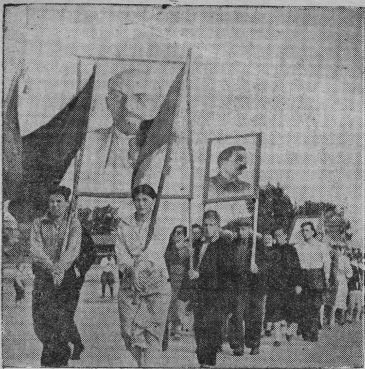
XXVI Международной Юношеской Лун Сыктывкары: СНИМОК ВЪЛЫН: Демонстрация вылын.