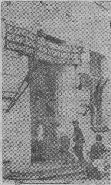
СНИМОК ВЫЛЫН: Велбдчысы мунбны Сыктывкарса 1-ой номера средней школаб.