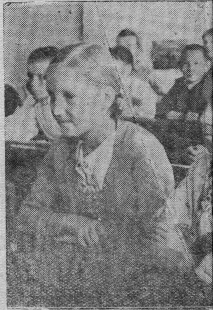
Выль велбдчан во завод