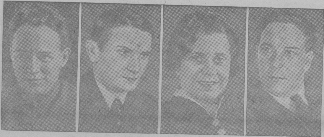
Наукаса, литератураса да искусства выдающойся деятельяс, кодыас полчитисны первой степени Сталинской премияс. СНИМОК ВЪЛЫН (шуйгавысянъ веськюдвыло): писатель Михаил Александрович Шолохов, СССР Наукаса Академияса действительной член, Трофим Денисович Лысенко, Ленин нима Сельскохозяйственной Наукаса Всесоюзной Академияса президент, Валерия Владимировна Барсова, СССР-са народной артистка, Ленин ордена СССР-са Государственной Академической Большой театраса артистка, Петр Леонидович Капица, СССР Наукаса Академияса действительной член.