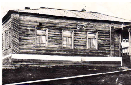
Здание аптеки №43 Снимок 1936 г.

За этим названием данного учреждения стоят люди (фармацевты, провизоры), они на страже здоровья людей, обеспечивают лекарствами больных.