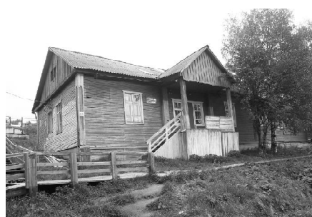
Здание аптеки №4 Построено в декабре 1959 г.

Со временем функции расширились, увеличились и штаты. В аптеке изготавливали и отпускали лекарства для населения, лечебно-профилактических учреждений, принимали заказы на очки,