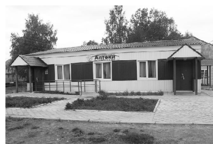
Здание аптеки №4 Построено в октябре 2009 г.

С годами требования к лекарственному обеспечению повышались, и условия работы не стали