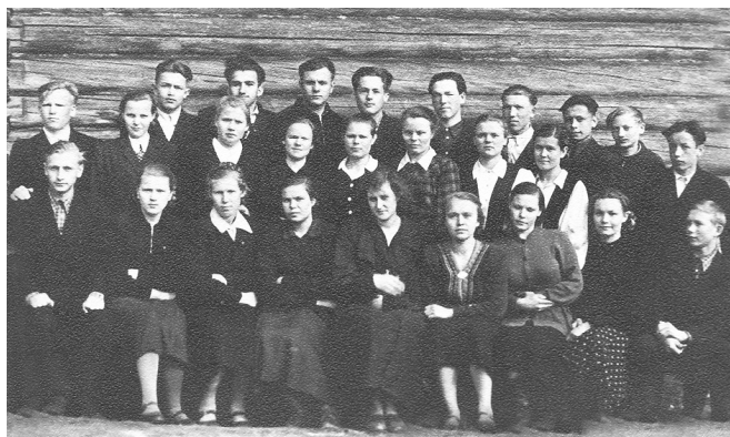
Кулөмдін шөр школа, 10 «а» класс, 1956-öд во