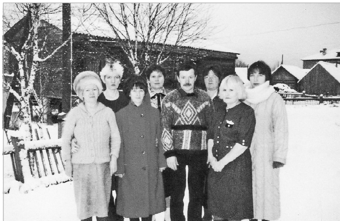
Типографияын вөвлөм уджалысьяс

1962-өд воын типография лои торъя учреждениеөн, но веськөділс редакцияса уджалысь. 1972-өд воын типография и редакция вуджисны Ленин улица вывса выль керкаө. Печатайтчыны воис выль оборудование, сійө өна кокньөдіс йөз-