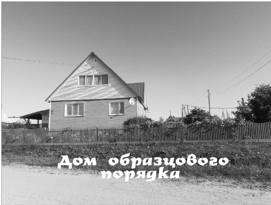
Дом образцового порядка

Лэдзӧны «Куломдин» сикт овмӧдчӧминлӧн Сӧвет да администрация