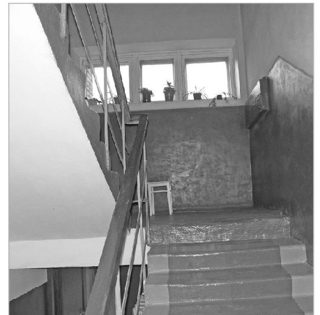
Самый чистый подъезд многоквартирного дома