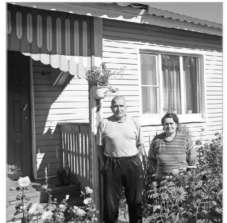
Лучший двор жилого дома