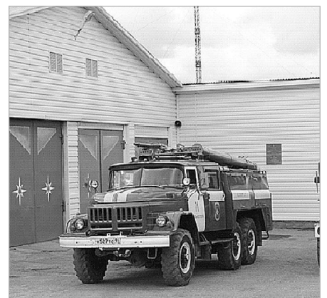
Лучшее благоустройство и озеленение закреплённой территории предприятия, учреждения