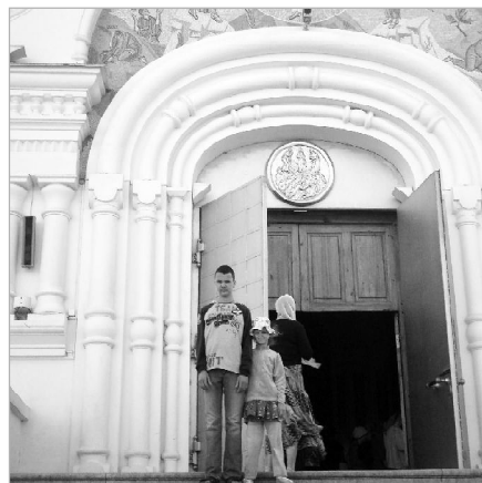
Хлопина Дарья Серафим Саровский вичко дорын

Таво ме шойччи «Митино» санаторийын. Быд лун ми вөчим зарядка, зев ёна гажөдчим, исласим көле-саа конькиён, самокат да катамаранъяс вылын. Катамаран - пыжсяма, сөмын интереснөйджык да гажаджык, көни пукалөны нель морт: өтиыс бергөдлө педаль, мөдыс веськөдлө, а кыкөн пукалөны бөрас да нимкодьясьоны.