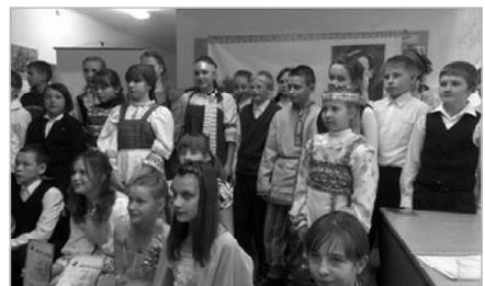
Конкурслөн финал, кывбур лыддысыяс