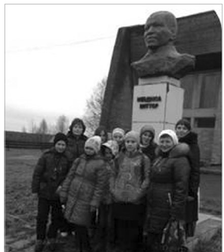
В.А.Савинлы памятник дорын