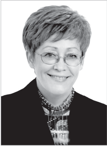
Уважаемые жители Усть-Куломского района!

Я приняла решение баллотироваться на пост главы нашего Усть-Куломского района, поскольку считаю, что люди должны иметь достойную жизнь – в первую очередь работу, зарплату, жилищные условия. Залогом честной и справедливой работы в должности главы с моей стороны является то, что Усть-Куломский район для меня родной. Всю свою жизнь я связала и связываю с районом и мне небезразлично, как здесь живет каждый житель, каждая семья. Здесь родились и выросли мои сын и дочь, растет внучка. У меня есть опыт хозяйственной работы, в том числе в качестве заместителя руководителя администрации района, где я занималась вопросами экономики, бюджетного процесса, социальной сферы. Знаю не понаслышке все поселки, села, деревни, где живут и работают добросовестные люди. Я знаю положение дел на предприятиях, на пилорамах, на фермах. Мне досконально известны проблемы школ, детских садов, больниц и ФАПов.