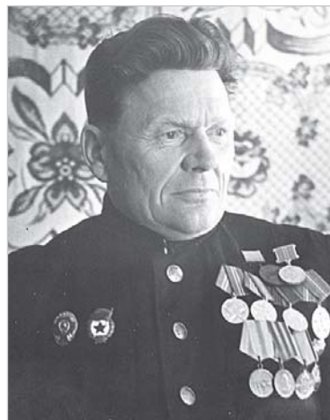
Николай Васильевич Игнатов