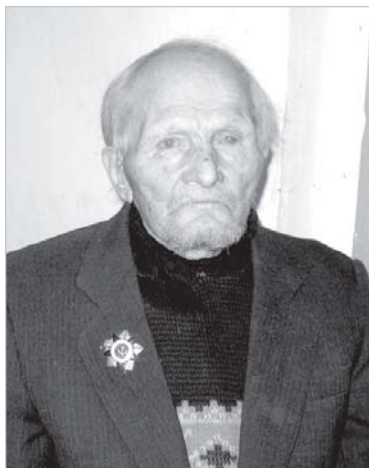
Александр Яковлевич Донской