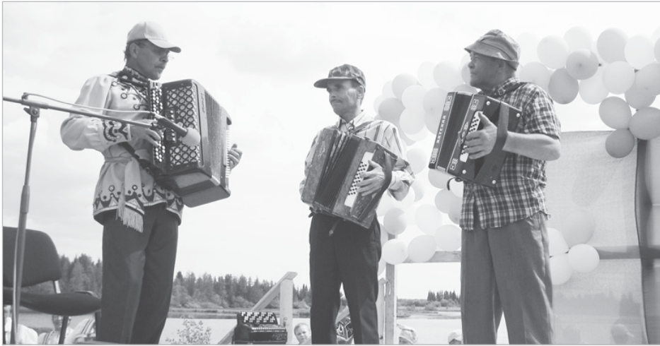
Керчомъя - энбиа йөзлөн сикт. Эмөсь тан поэтыас и сыланкыв тэчысыас, а медся унаөн - гудөкасысыас. Татөг оз мун ни өти «Пыжа гаж».