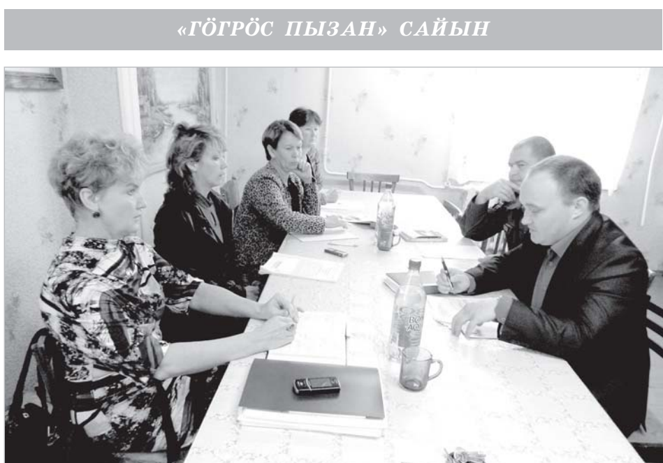
«ГӨГРӨС ПЫЗАН» САЙЫН

Выль пыртомлөн туйвизьон лоө быдсыма оборудование босьтөм. Школаса пусянинъясө (медводз сиктсаясө) колана оборудование вайөм кузя республикаын муно конкурс. Миянлы воас 218 колана оборудование. Татчө жө пырө автобусъяс ньөбөм. Таво Помөсдинө да Немдинө воис кык автобус. Öтыис - федерациялөн, мөд-