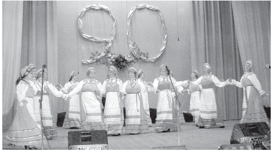
Культура сөвмөдөмө ыджыд пай пунктө «Эжваса дзоридзьяс» народной хор.