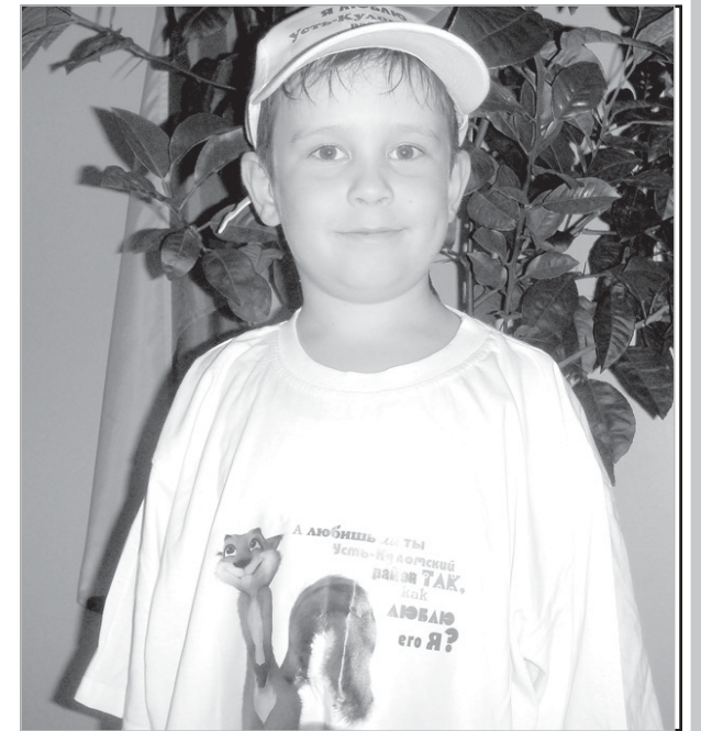
Первая сувенирная продукция с символикой Усть-Куломского района

Все эти проекты направлены на развитие нашего района. Понятно, что данные проекты только подходят к своей реализации. Тем не менее их наличие показывает, что в Усть-Куломском районе инициативные, активные люди есть.