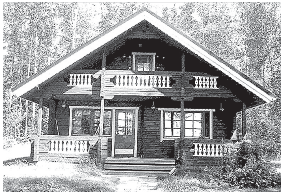
Планируется, что гостиница будет изготовлена по образцу финских гостевых домиков

Сиверного кордона. Кроме того, необходимо будет осуществить ремонт дорог, а также ремонт и дополнение объектов, которые войдут в туристический маршрут (строительство кемпингов и бани в районе базы отдыха «Пожома Яг»); провести инвентаризацию, ремонт и восстановление имеющихся на Асыв-Воже зданий, оборудовать туристско-альпинистский полигон,