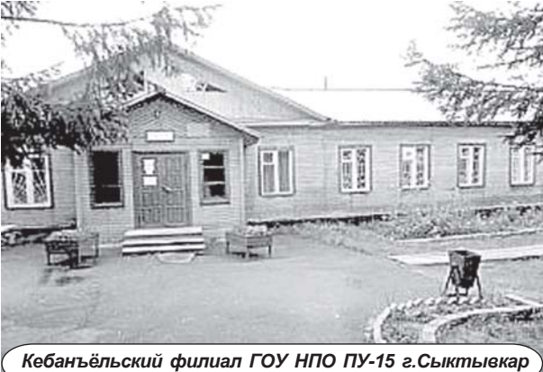
Кебангёлский филиал ГОУ НПО ПУ-15 г.Сыктывкара