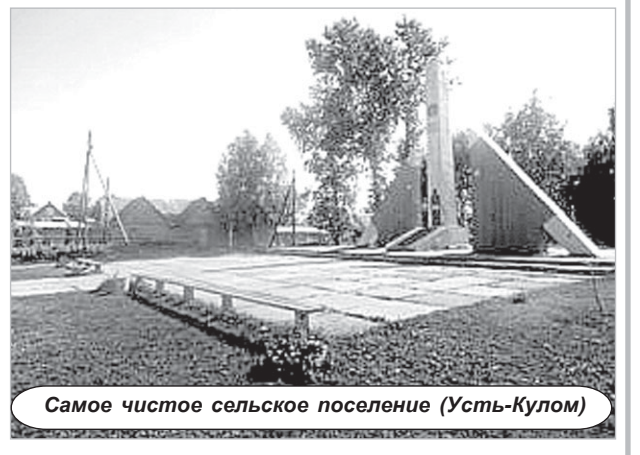
Самое чистое сельское поселение (Усть-Кулом)

Администрация муниципального района «Усть-Куломский» благодарит жителей района за инициативу, проявленную в период проведения смотра-конкурса, и надеется на дальнейшее плодотворное сотрудничество.