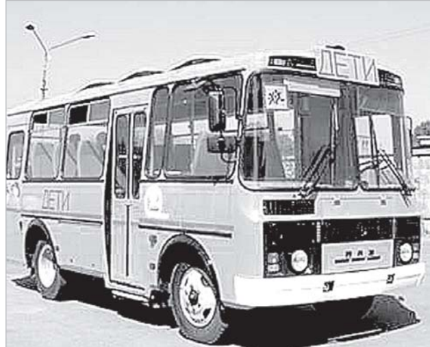
В 2011 году Усть-Куломский район получил 2 новых автобуса для перевозки школьников

Адрес официального сайта, на котором размещена информация об аукционе: www.rkomi.ru