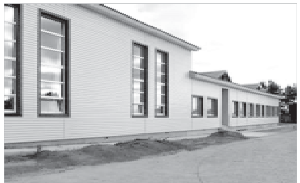
Школа в п.Ягкедж

На высоком профессиональном уровне организованы и проведены мероприятия, посвященные дням культуры