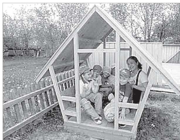
Несколько сельских поселений получили новые детские площадки

Впервые за многие годы два сельхозпредприятия района вошли в перечень программ