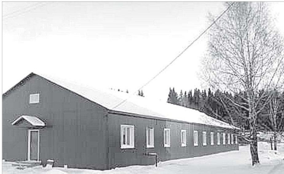
Больница в с.Деревянск

Не менее актуален и жилищный вопрос. Завершено строительство первой секции 24-х квартирного жилого дома по ул.Ленина в с.Усть-Кулом. Дом предназначен для переселения жильцов из аварийных домов. На сегодняшний день завершен ремонт 8-ми квартир. Район активно принимает участие в программе «Социальное развитие села», в рамках которой запланировано предоставление 37 субсидий для жителей района на завершение строительства индивидуальных жилых