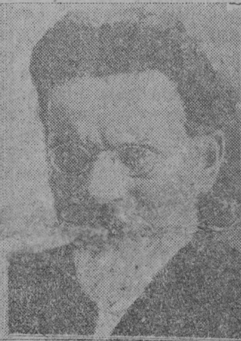
М. І. Калінін.