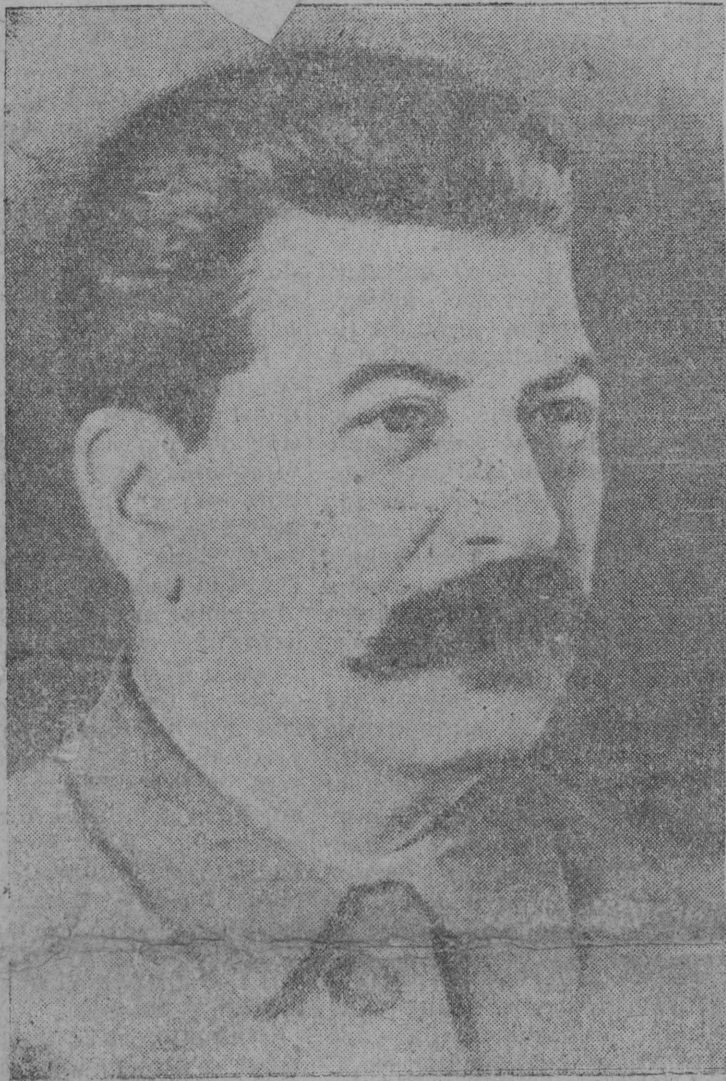
И. В. Сталин.