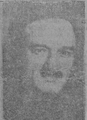
А. І. Мікојан.