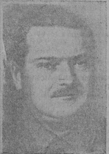
А. А. Жданов.