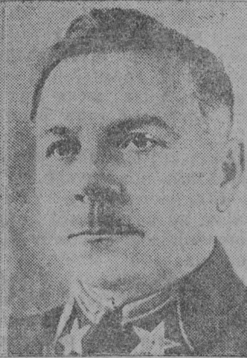
К. Је. Ворошілов.