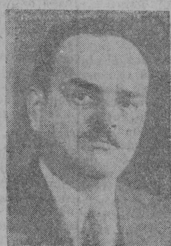
Н. М. Швернік.