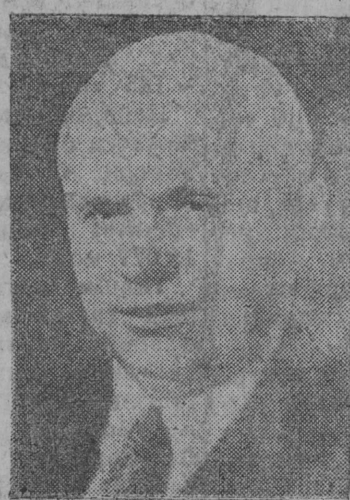
Н. С. Хрущев.