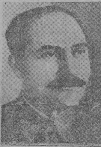
Л. М. Кагановіч.