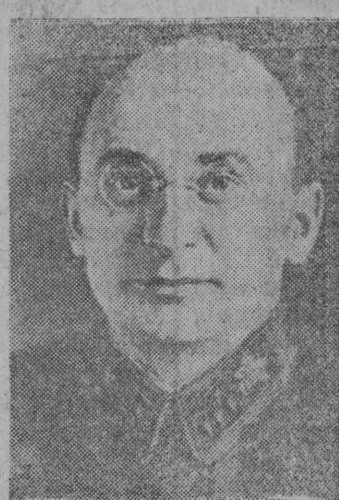
Л. П. Беріја.