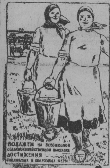
Плакат художника Еремина выпущенный изд-вом „Искусство“ к Всесоюзной Сельскохозяйственной Выставке. Перерисовка Лисевича Бюро канше ТАСС.