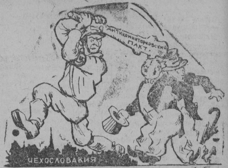
—Господа, неужели вы не знакомы с „антикоминтерновским пактом“?

Так называемый „Антикоминтерновский пакт“ вернее было бы назвать пактом, направленным против Англии и Франции (Из газет).