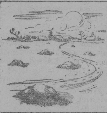
Как не надо укладывать навоз в поле.

Практика прошлых лет показала, что в тех колхозах, которые не сумели организовать вывозку основной массы навоза в зимний период, огромное количество его оставалось совершенно неиспользованным. В Сибири, юго-восточных, южных и центральных областях Союза почти в каждом районе имеются залежи в десятки и тысячи тонн старого перегноя. Это ценное удобрение необходимо теперь полностью вывезти на колхозные поля.