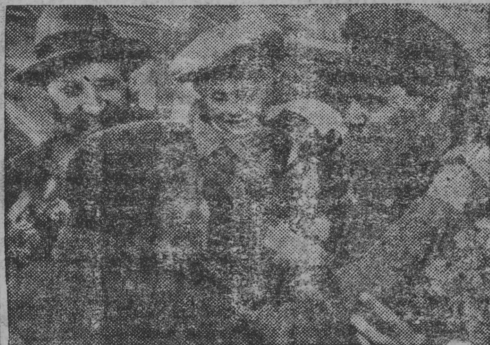
Герой Советского Союза тов. М. В. Водопьянов возвратился из большого арктического перелета.

За отличную работу и выдающиеся достижения, связанные с постройкой самолета „АНТ-25“, его испытатели и организаторы перелета ЦИК СССР наградил; 9 товарищей орденами Красной звезды, 9—орденами трудового Красного знамени и 27—орденами „Знак почета“.