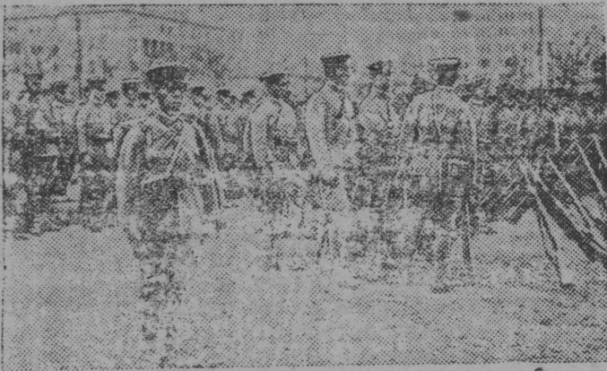
НА СНИМКЕ: отряд студентов японской военной академии, отправляющийся из Токио в Манчжоуго.