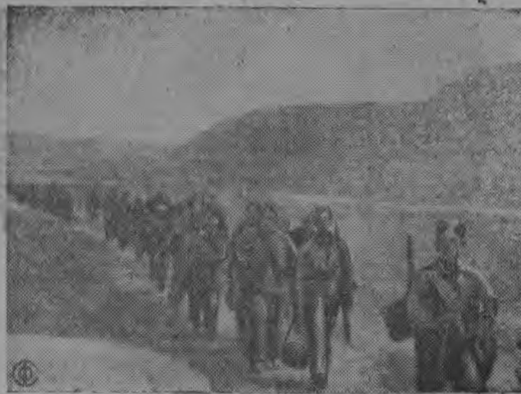
Республиканскөй војскајас отр'адлөн важ Сарагосскөй туј куза мунөм (Асыввыв фронт).

Испанияса фронтјас вылын.