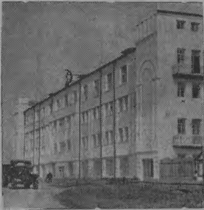
Сыктывқарын Печат керка.