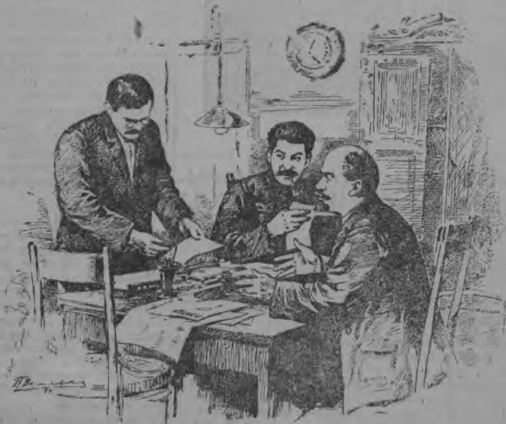
В. I. Ленин, I. В. Сталин да В. М. Молотов јортјас „Правда“ газет редакцијын (1917 во).

Мај 5 лунд тырi 120 во мiрөвöй пролетариатлөн гениальнöй учитель да вожд, научнöй коммунизмлөн основоположник Карл Маркс чужанлуңсан.