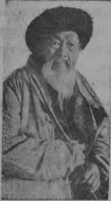
Казакстанса народнөй певец орденносец Джамбул.