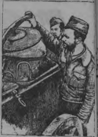
Республиканскөй частын пөвар дастө бөбөд республикаса бојенјаслы.