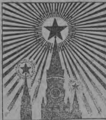
СџВџТАТ ЗВЕЗДЫ ЛУЧИСТО НА КРЕМЛЕ,