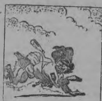
„Крепко бїла Красная Армія японскїх интервен- тов“.