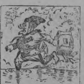
„Крепко бїла Красная Армія белых генералџв“.