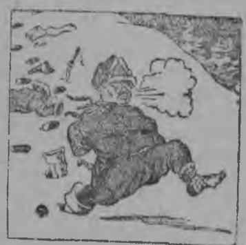
„Крепко бїла Красная Армія кулацкїх атаманџв“.