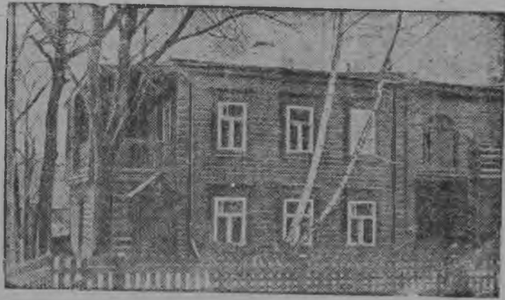
На снимке: Дом—музей В. И. Ленина в г. Казани. В этом доме с сентября 1888 г. по май 1899 года жила семья Ульяновых.

Но колб пасыны, мы уж вын содбм пбшті абу. Вбрлэцдмын стахановској тблыс заводічбмсан содіс сбмын 6 морт да 6 вбв. Леспромхоз уна вбручастокыс оз тбд уж состојаніесб. Уса куца вбручастокјассан абу некушбм сведеніе.