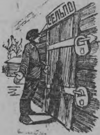
СНИМОК ВЫЛЫН „Лав-каын ыджыдалѳ беспорядок“ статьялы иллюстрация.