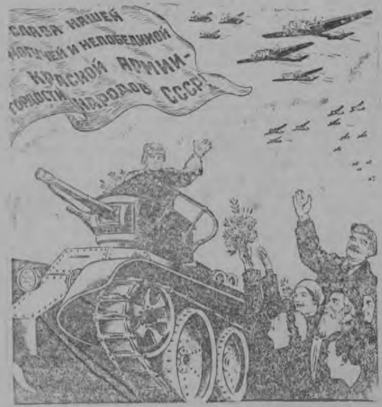
Рисунок В. Баркова и В. Лисевича

Тувсов гөра-көдза кежлö дасьтысьöм—колхозьяслөн бня боевой мог. Сысы, кутшöма лёб нудöма дасьтысяна уджъяс, кутас завистны сылөн успех.