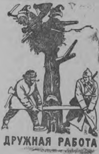
Репродукция с плаката, посвященного событиям в Финляндии, выпущенного издательством „Искусство“.

ВКП(б) райком военной отделеа заведующёи.