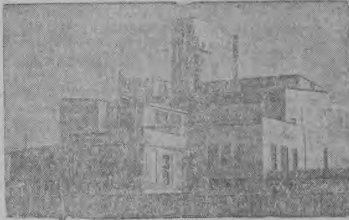
Новая электростанция в г.р. Якутске