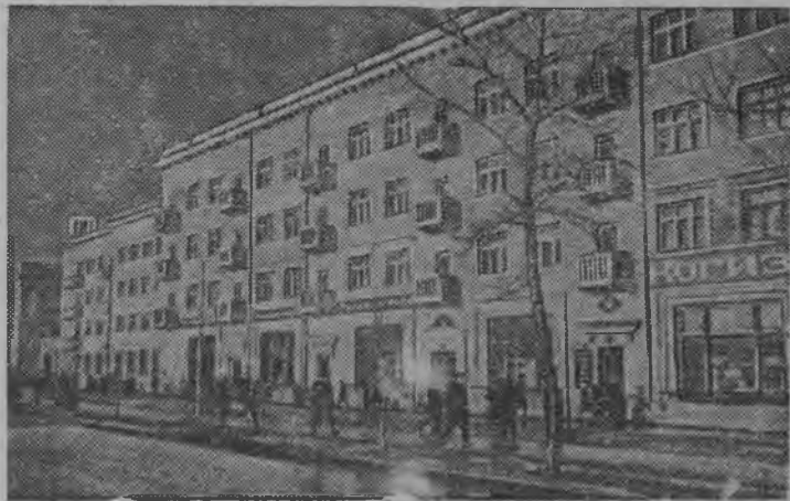
Новый дом на улице Культуры в г. Горьком.