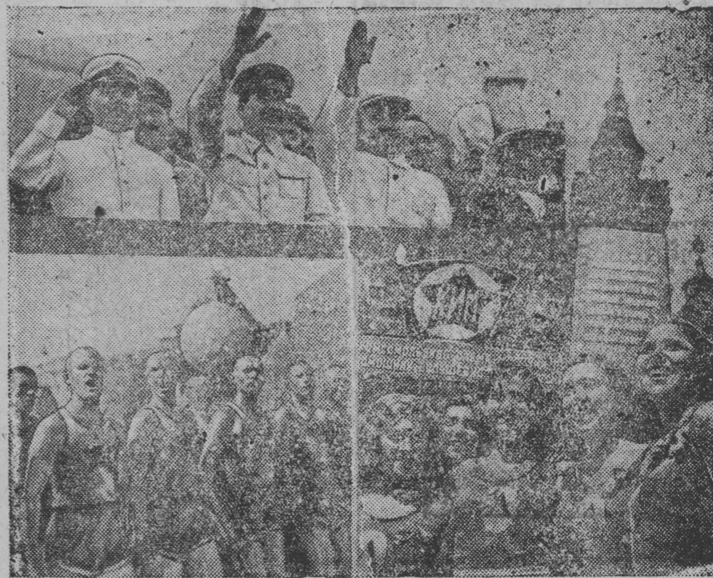
НА СНИМКЕ: вверху—с трибуны приветствуют проходящие колонны т. т. СТАЛИН, МОЛОТОВ, ВОРОШИЛОВ, КАГАНОВИЧ, КАЛИНИН, ДИМИТРОВ и другие. Внизу—прохождение колонн физкультурников.

30 июня в Москве на Красной площади, состоялся парад физкультурников, в котором приняло участие около 115 тысяч человек. После торжественного марша физкультурников состоялись грандиозные спортивные гимнастические выступления. Различные упражнения исполнили пионеры, гимнастическая группа профсоюзов, студенты Московского и Ленинградского институтов физической культуры, слушатели курсов колхозников—физкультурников Московской обл. и др. Парад показал высокое качество физического воспитания трудящихся, явился грандиозной демонстрацией мощи страны советов.