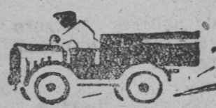
Абу места жежыд бандит МИ-