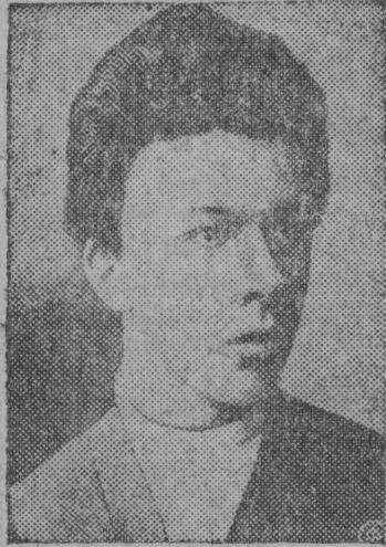
Александр Илјич Улјанов В. И. Ленинлбн вок.

Цар Александр III-ј вы-лб покушенiје вбчны за-водитбмыс 1887-бд воын мај 20-бд лунб лоiс казнi-тбма царбн Петербургеа Шлисербургскбј крепо-стын.