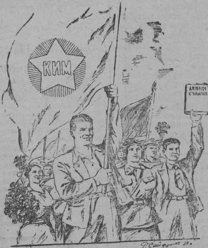
Да здравствует XXIII Международный юношеский день!