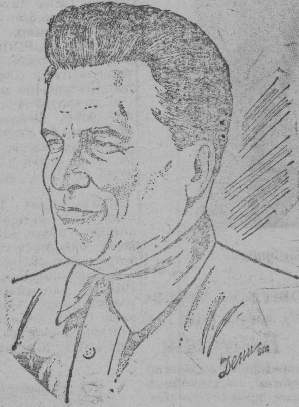
С. М. Киров

Гергеј Мироновичлыс ужавны велддчдны миллионјас. Рабочдјјас, крестана да советскдј интеллигенција, кодјас кыпыда нимкодасдны да горддчдны Сталинскдј Конституцијадн, выл победајас перјдмдн муны Гергеј Миронович Кировдн муна тујт—коммунизман.